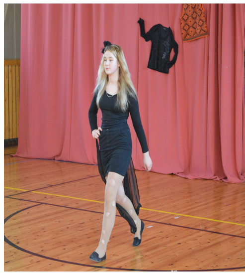
Mariann „Valguses ja pimeduses”