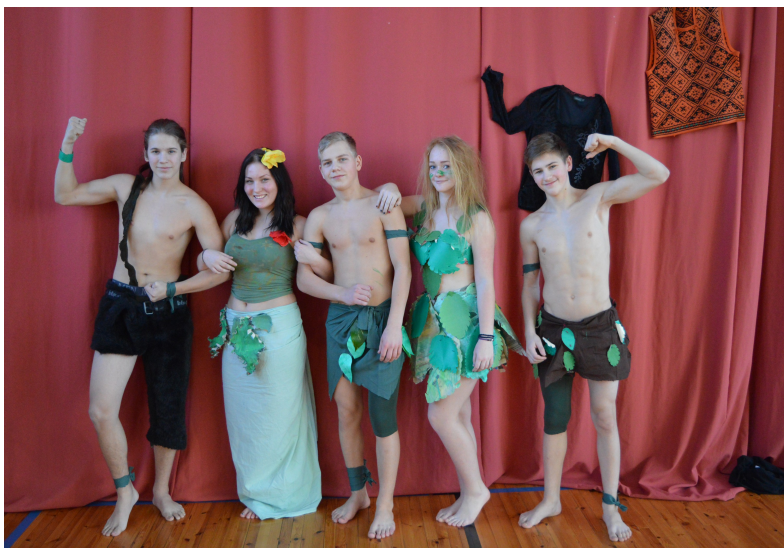
Looduslapsed on õnnelikud võitjad.