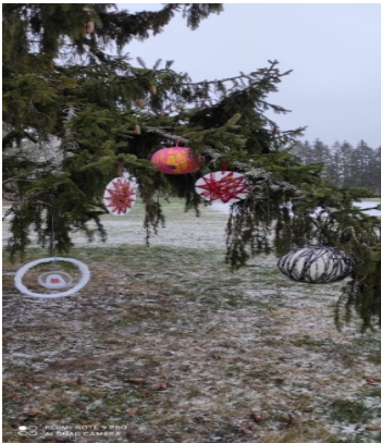
Uusna lasteaia Kalmetu koolirühma jalgpallist jõuluehted