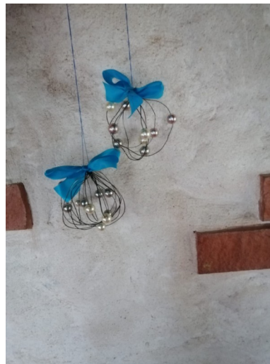
Karin Kala traadist, pärlitest, pakkepaelast valmistatud jõuluehe