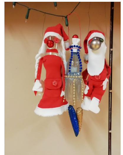
Pille Sihver: rõõmsad päkapikud