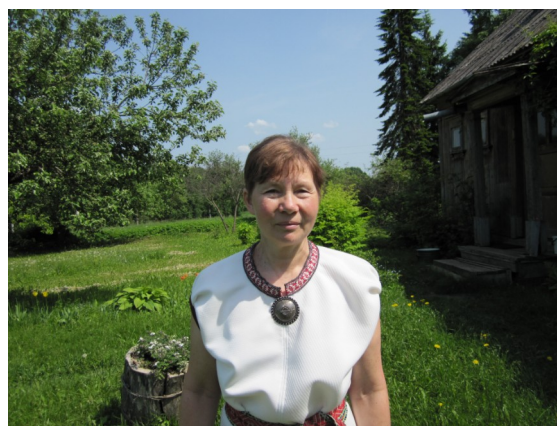
Aita oma aias