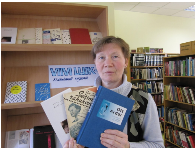
Aita raamatukogus tööl