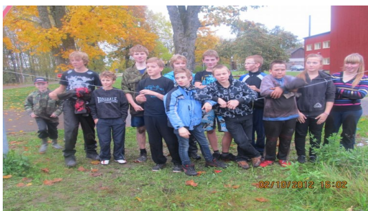
7. klass maastikumängul