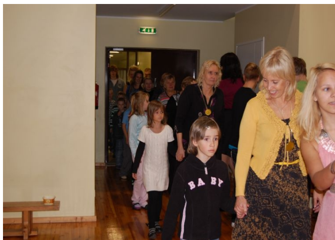
1. klassi õpilased toovad saali "uued üheksandikud"