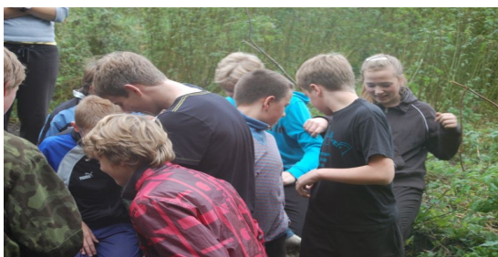
Otsitakse punaseid komme