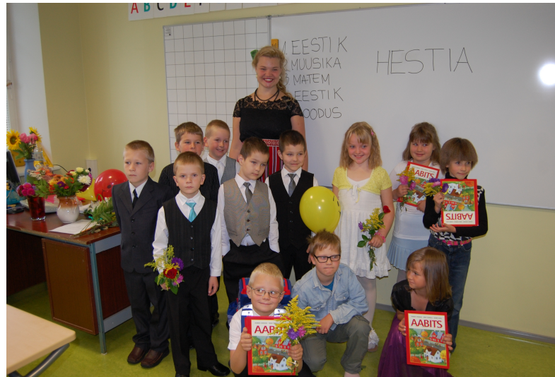
klass oma uue õpetajaga