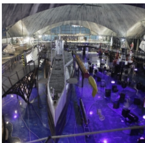
Allveelaev Lembitu meresadama muuseumis