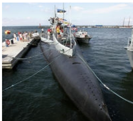
Allveelaev Lembitu meres