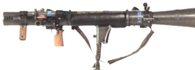
Carl Gustav granaadiheitja