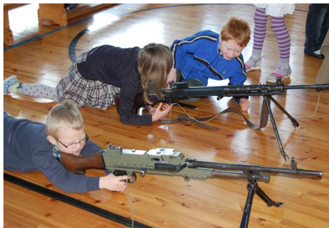
Poisid võtavad laskeasendisse