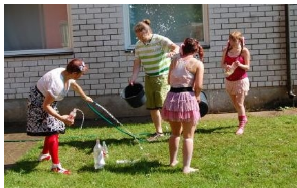
Õpetaja hullab oma klassiga