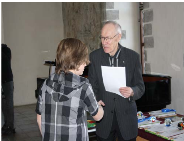
Ivar saab auhinna

Käisin laupäeval, 6. aprillil Sten Roosi muinasjutuvõistluse parimate autasustamisel Tallinnas.