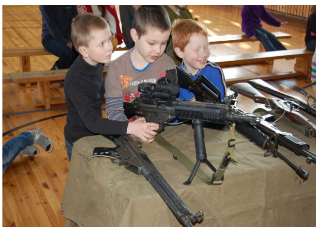
Poisid tutvuvad relvadega