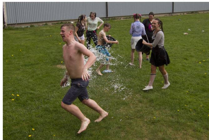
Sportlik märjutamine. Fotod kooli koduleheküljelt