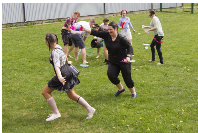
Tutipäeval täielik sportlik tegevus: märjutamine