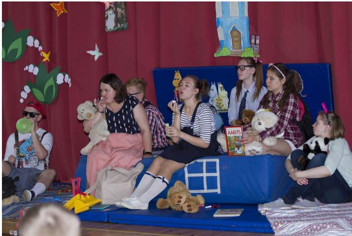
"Muumimamma" koos oma lastega viimasel koolikella päeval.