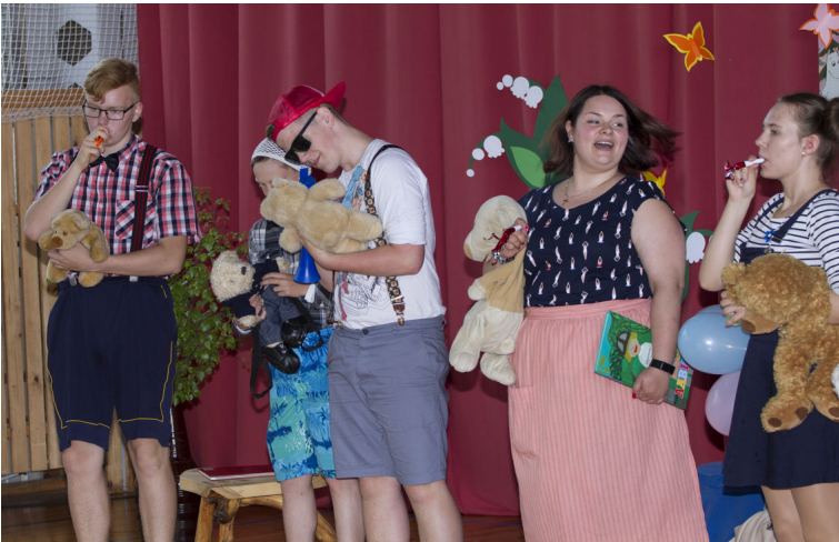
"Muumimamma" juhendab oma lapsi

Vana koolimaja ei mäleta ma üldse, kuna olin seal ainult aasta, kuid mäletan 2. klassi, kus algklassid õppisid rahvamajas ning koolimaja oli remondis. Rahvamajas eraldas klasse ainult kardin ning söömas