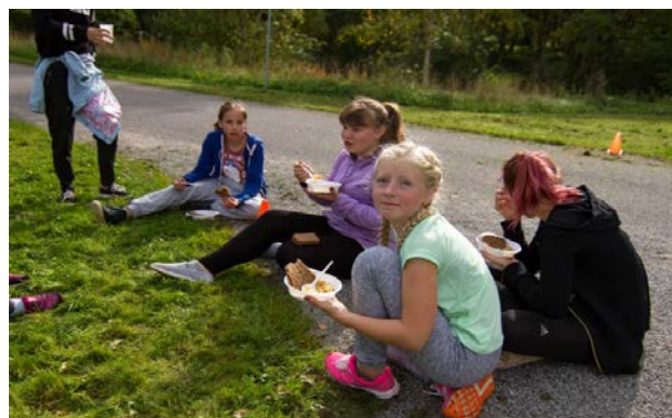
Söömine Tusti järve ääres

31. oktoobril toimus Kalmetu Põhikooli sünnipäeva raames traditsiooniline aastapäeva jooks ning tulemused olid järgmised: