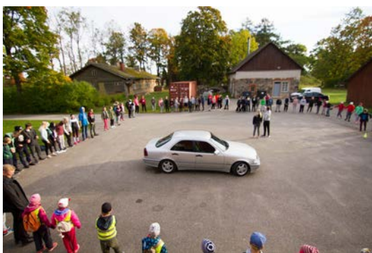
Alustasime matka Tusti järve äärde