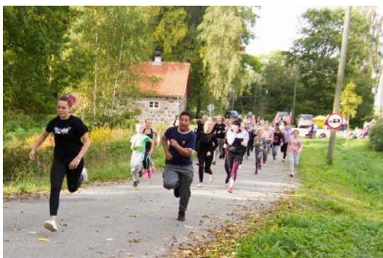
Jooks Tusti järve ümber