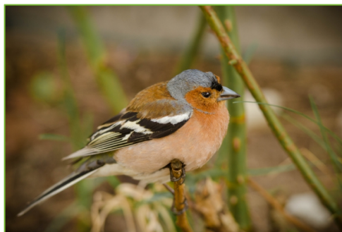
Pilt 1. Rene Jakobson. Metsvint.