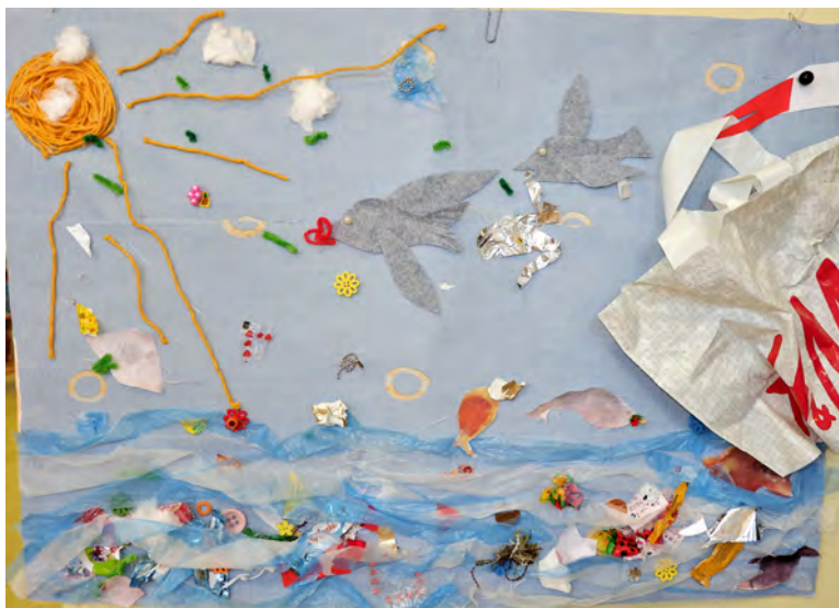
Piibe Arakas, Pille Suvi 4. klass