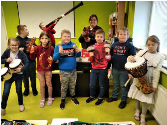
Uued muusikavahendid meie koolis