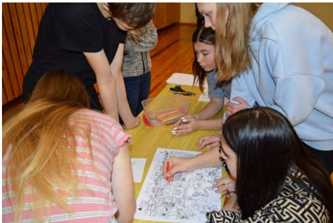
Kalmetu Oskaja võistlusel