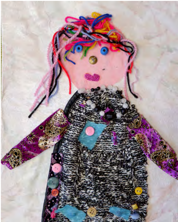
Janela Bernhardt 1. klass