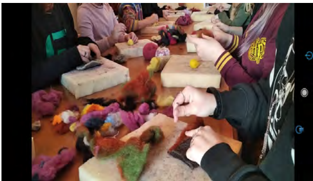
Neiud õpivad viltimist