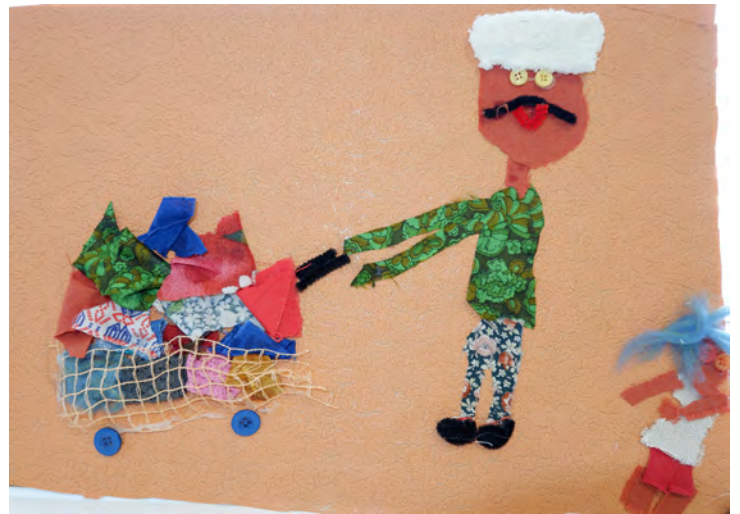
Romet Grünberg 5. kl