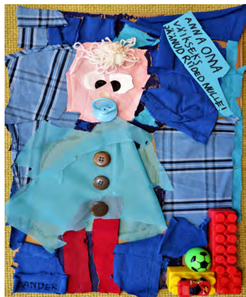
Sander Abel 1. klass