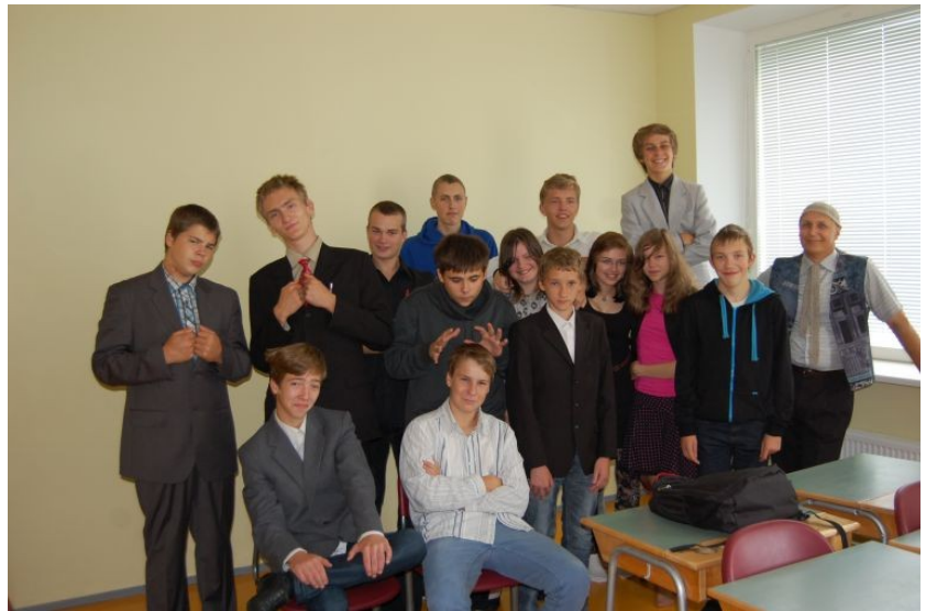
9. kl alustamas oma viimast kooliaastat