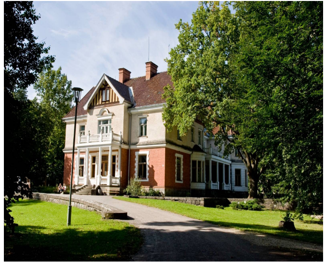
Olustvere loss, kus sõime lõunasööki