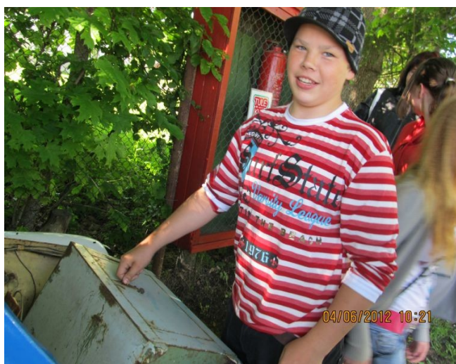
7. klassi Lauri on Rakveres ekskursioonil

Meil oli tehtud hästi suur lõke ja olid ka olemas tulekivid. Saarel pidasime ka traditsioone, nagu näiteks Uus aasta, munadepühad, jõulud ja kolmekuningapäev. Loomulikult tähistasime ka sünnipäevi. Keegi ei tahtnud sealt saarelt minema ka seilata, saar oli meile nii tähtis. Jäime sinna kauaks ning elasime oma kaunist elu edasi.