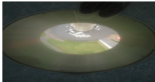
Teletorni vaateplatvormist alla vaade