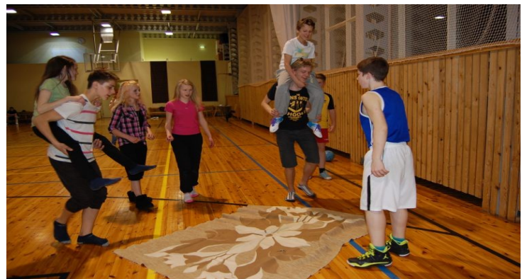
Õpilased saalis võistlemas