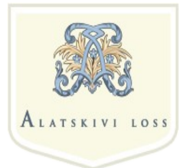
Alatskivi lossi muuseumi logo