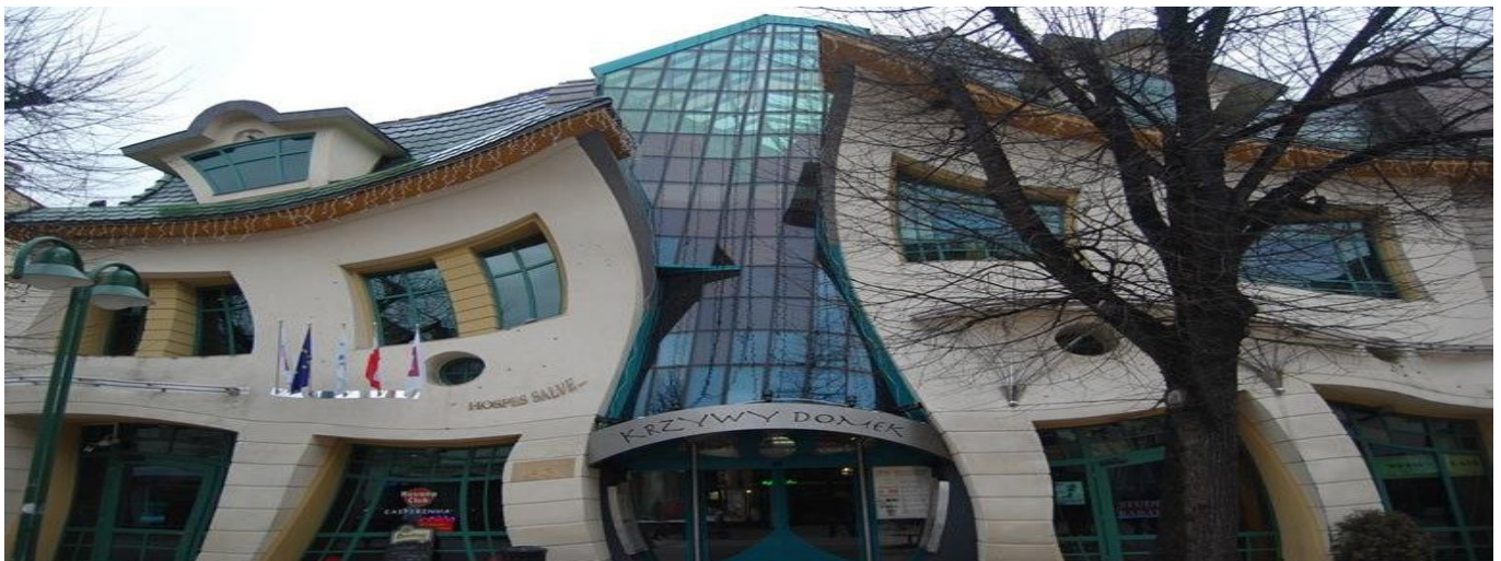
Köver maja Poolas Sopotis

Juunikuu lõpu poole ehk enne minu sünnipäeva kinkis isa mulle 110cc krossiratta. Ka sellega sai palju sõidetud ja seda ka natuke remonditud.