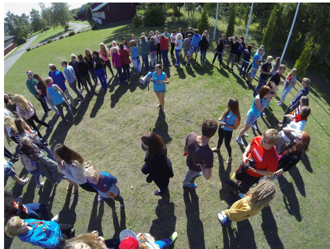
Eesti Õpilasesinduse Liidu Laager 2014

Käisin suvel reisimas mööda Eestimaad ja Lätis. Lätis käisin lõbustuspargis, seal oli väga tore. Mere ääres Pärnumaal oli mõnus päevitada ja ujuda, seal oli ka mõnus seltskond, mis tegi päeva veel mõnusamaks.