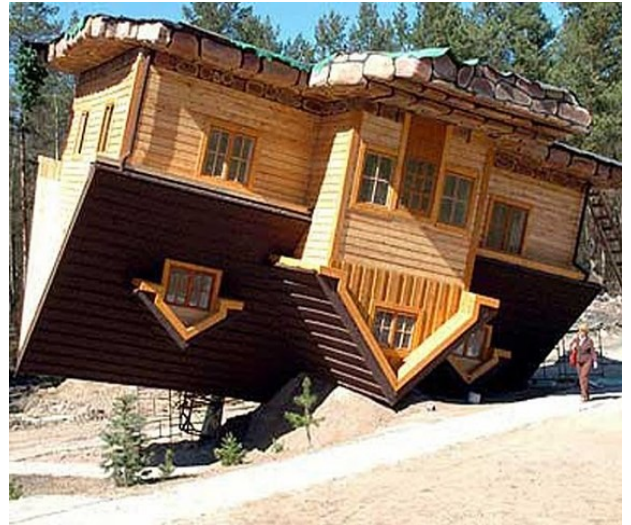
Tagurpidi maja Poolas Szymbarkis