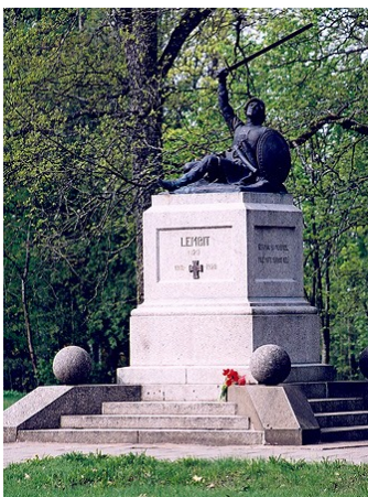
Lembitu ausammas Suure-Jaanis