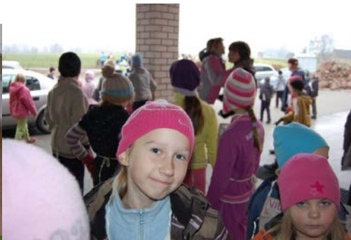
Lisell aastapäeva jooksul 2010