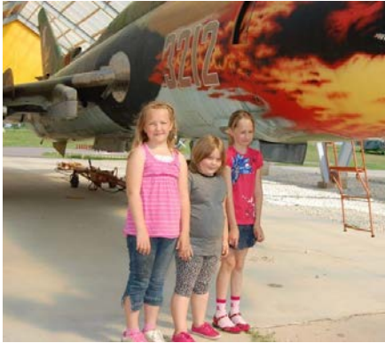
Algklasside ekskursioon 2011