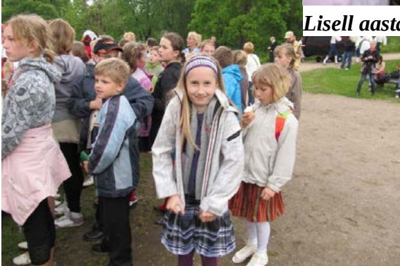
Lisell laulupeol 2010