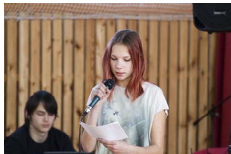
2017 aktusel esineb Gedy-Ly