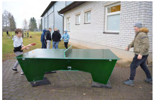
Pinksilaud on valmis.

Karin Mägi ( Kalmetu Põhikooli huvijuht)