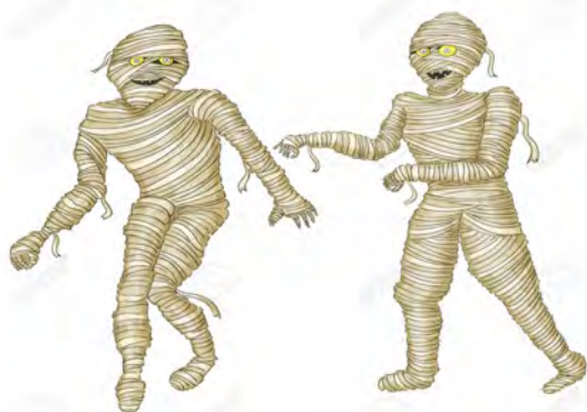
Kaks muumiat kaheteistkümnest