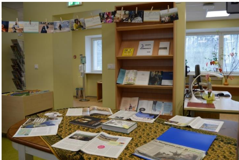
Näitus Ena Metsa töödest