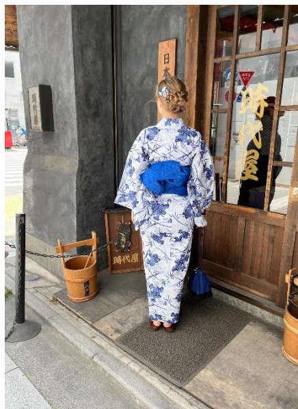
Anni kimonos Tokyo tänaval