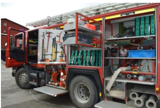
Sai tutvust teha tuleõõrujate tööga