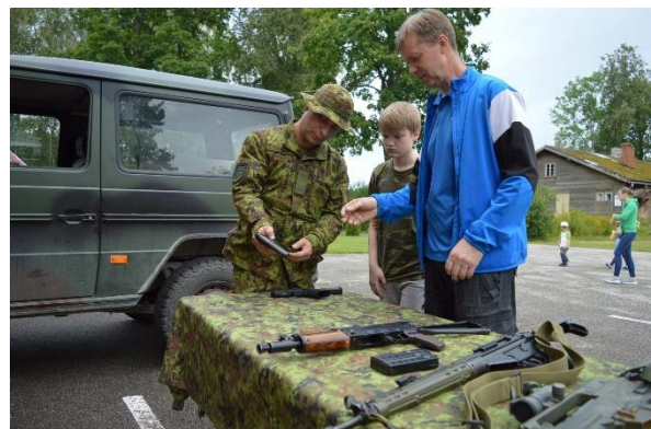
Sakala malev tutvustab oma varustust