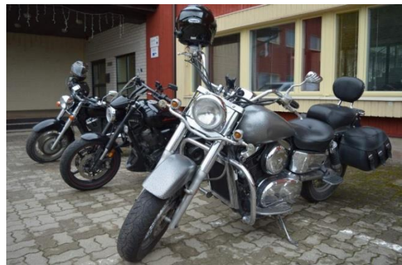
Mootorrattad ilmestavad Kalmetu kooli esist