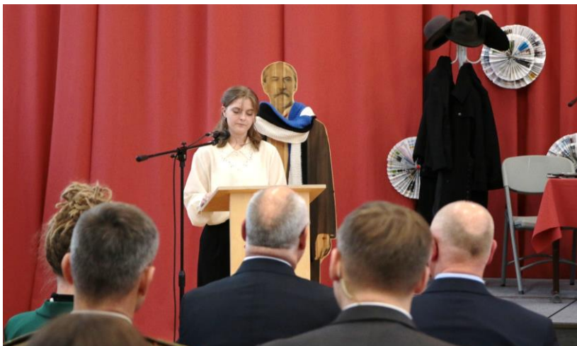
Kirjanduse päeval peetud kõne, kui külas oli vabariigi president