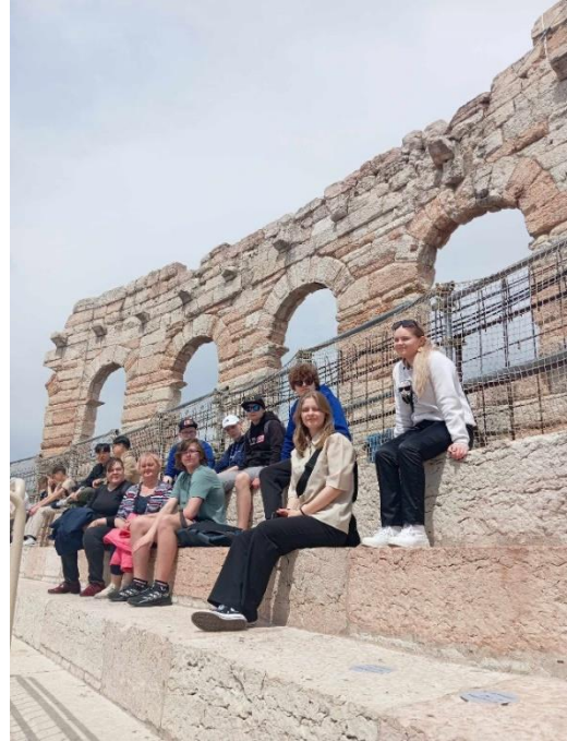
9. klass istumas amfiteatris