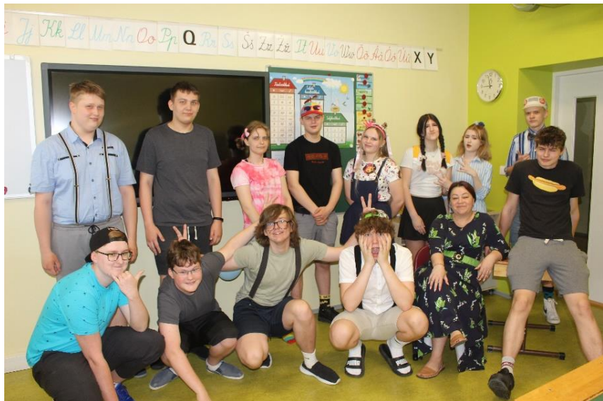
9. klass tutvapäeval koos esimese klassijuhatajaga