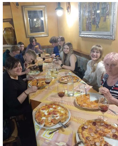
Esimene söömine pitsarestoranis