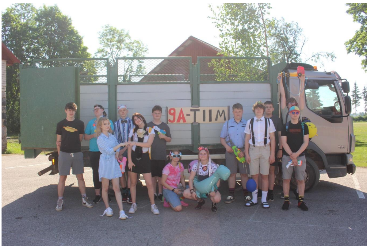
9. klassi lõpetajad tiirutasid kohaliku talumehe autoga ringi tutipäeval .....