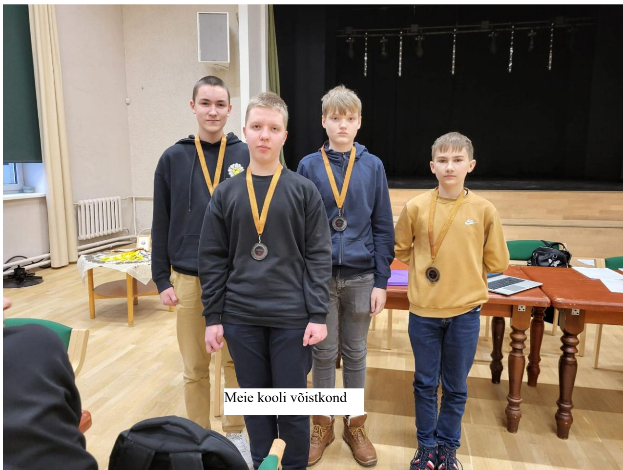
Meie kooli võistkond