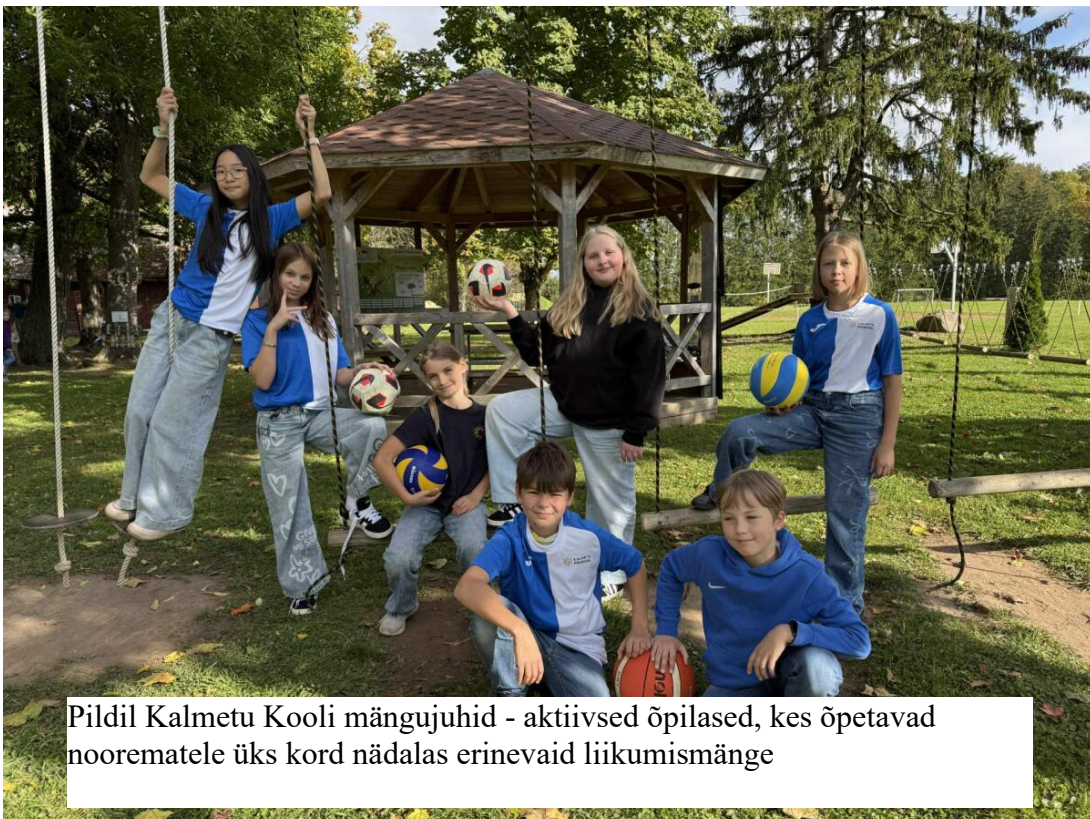
Pildil Kalmetu Kooli mängujuhid - aktiivsed õpilased, kes õpetavad noorematele üks kord nädalas erinevaid liikumismänge